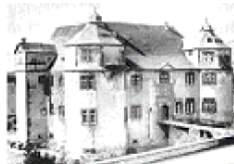
Das obere Schloss