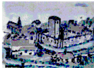
Entwurf, das untere Schloss