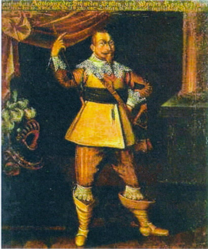
Gustav Adolf von Schweden