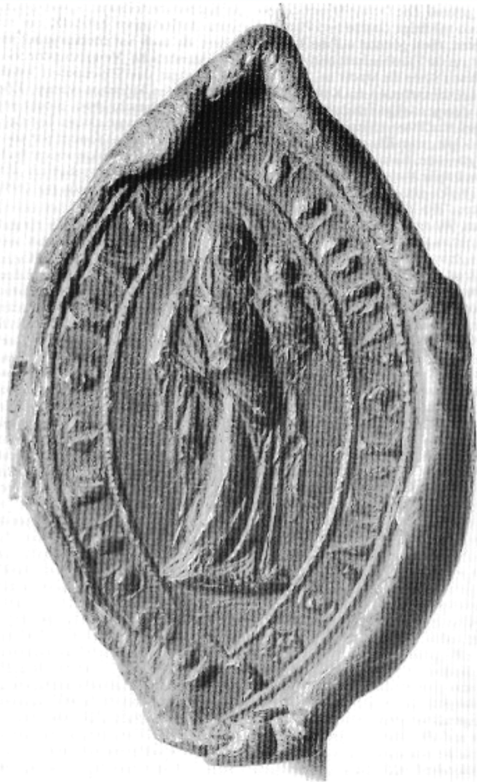
Siegel des Klosters; zugleich Wappen (Maria mit dem Kind), Staatsarchiv Würzburg Seligenhofen / Couventu