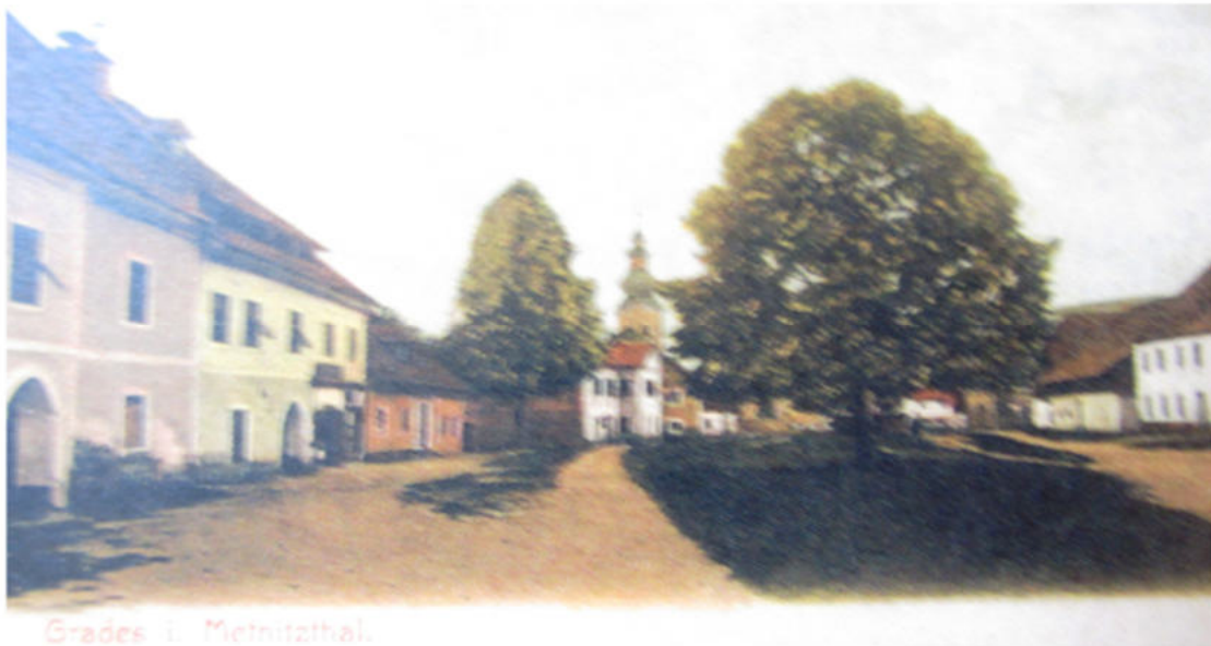
Bild: Marktplatz von Grades. Länge 200 Metern und Breite 60 Metern.

Unter dem Haus steht ein Marterl und daneben ein kleiner Holztrog der mit Quellwasser gespeist wurde.